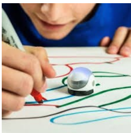
Figura 3. Un Ozobot in azione su un percorso creato da uno studente.

Dopo aver brevemente discusso delle risposte attese, concentriamoci ora sulla parte relativa all'uso che si vuole fare in questo progetto didattico della robotica. Abbiamo scelto di trasportare la storia di Buzzati con gli Ozobot (Figura 3) perché questi artefatti robotici vengono utilizzati da diversi anni nel nostro istituto per avvicinare gli studenti al coding e alla programmazione a blocchi, ma soprattutto perché per stimolare l'apprendimento della matematica negli allievi occorre dominare con capacità critica lo strumento che si utilizza (e non essere dominati) apprezzandone vantaggi e svantaggi. La scelta degli Ozobot ci consente anche di mettere alla base della nostra attività di robotica educativa l'apprendimento come costruzione attiva del sapere in interazione con il mondo tramite la manipolazione degli oggetti, come evidenziato storicamente da Piaget (1954), i cui movimenti nello spazio devono essere programmati attraverso un linguaggio di programmazione semplice (usa una programmazione a blocchi chiamata Blockly, molto simile al più famoso Scratch).